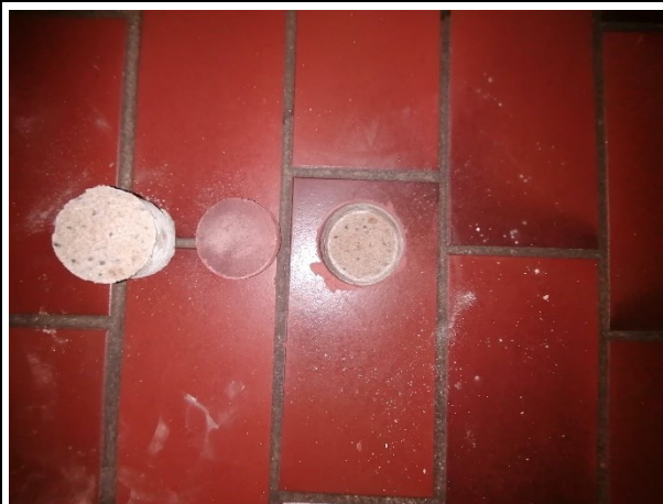
Bild 8: Erkundung Fußbodenaufbau im Büroraum (exemplarische Darstellung), Ergebnis: PVC-Rollware (neuartig), Ausgleichschicht (M19 – kein Asbest), Zementestrich, PE-Folie, EPS-Dämmung (M25 – HBCD-haltig), Bodenplatte/Betondecke.