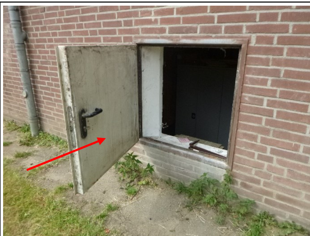
Bilder 1 und 2: Vereinsgebäude in Massivbauweise, Sichtmauerwerk, Flachdachkonstruktion wetterbedingt nicht geöffnet) Mineralwolldämmung (unterstellt KMF, K1B-Material) in der Deckenkonstruktion. FH-Tür, unterstellt asbesthaltig /KMF-haltig.