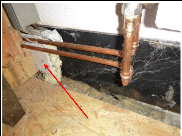
Bild 11: Untergeschoss. Decke Gipslochdecke (M15 – kein Asbest) Wände: Sichtmauerwerk mit Farbanstrich, Fußboden: OSB auf Holzkonstruktion (neuartig) Mineralwolle im Fußbodenaufbau (unterstellt KMF, K1B-Material)