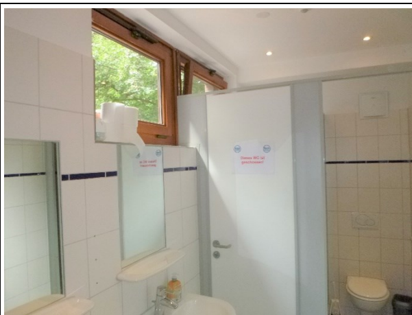
Bild 14: Obergeschoss, Nassraum, Decken GK-Leichbau (neuartig) Wände Verputz, Wandfliesen neuartig. Fußboden Steinfliesen wie vor.