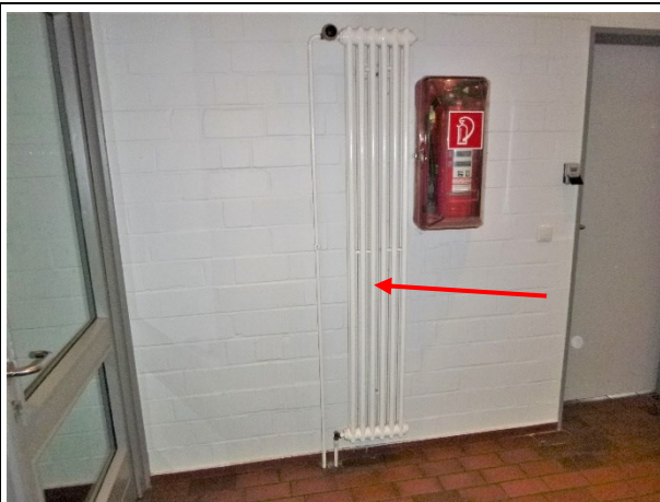
Bild 3: Wände und Decken überwiegen Sichtmauerwerk mit Farbanstrich. Boden: Steinfliesen in Dickbettmörtel, kein Asbestverdacht. Bild 4: Rippenheizkörper, Altbestand, unterstellt asbesthaltig .