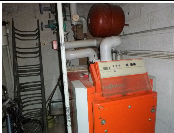
Bild 15 und 16: Heizungsraum. Gasheizung, Rohrleitungen mit Mineralwolldämmung (KMF, unterstellt K1B-Material)